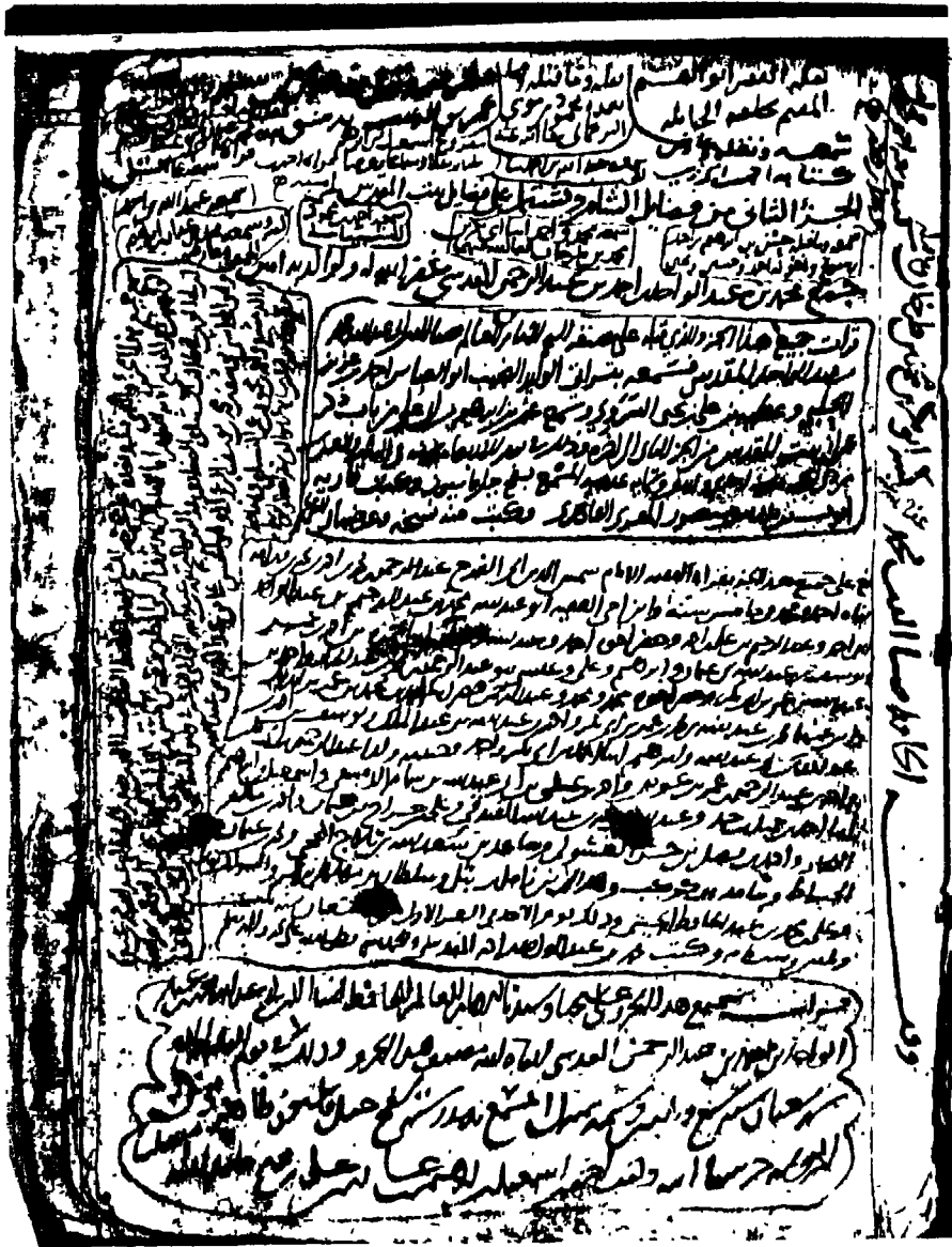
صفحة عنوان الكتاب وعليه جملة من السماعات